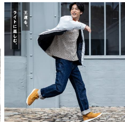
王道を、 ライトに楽しむ。