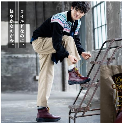
軽やかなのが今、 ワールドなのに、